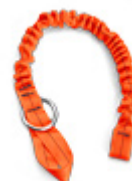
577 43 80-01 Motorsågsstropp

En verktgskrok med robust konstruktion. Passar alla löstagbara bälten. Konstruktionen gör det lätt att hänga en motorsåg i bältet med bara en hand.