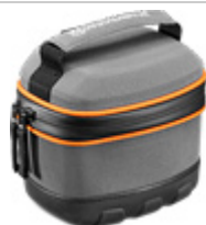
585 37 18-01 Batteriväska

Thermo beläggningen håller lämplig arbetstemperatur på batteriet även under mycket kalla eller varma klimatförhållanden. Lätt att bära både med bälte eller krok för arborister.