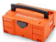
585 42 87-01 Batteribox Liten

Isolerande, vattenskyddad och stötdämpande väska för Husqvarna BLI batterier (BLI 60/80/110/150). Thermo beläggningen håller lämplig arbetstemperatur på batteriet även under mycket kalla eller varma klimatförhållanden. Lätt att bära både med bälte eller krok för arborister.