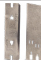
505 69 81-03 Ryrtarmall 3/8" MINI

Komplett med handtag, kombimall*, 2 rundfiler och 1 flatfil. Med filmallen erhålls rätt filning av skärtand och underställning. * I vissa fall är kombimallen ersatt med filmall och underställningsmall