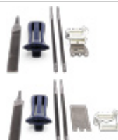
580 68 75-01 Filkit

Fästögla med unik konstruktion, gjord för arborister som använder en vanlig motorsåg. Ger ett säkert sätt att koppla motorsågen till motorsågsstroppen. Frikopplas vid överbelastning.