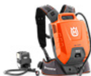
966 77 60-01 Ryggburet Batteri

Litiumjonbatteriet ger effekt som räcker långt, och har en utmärkt prestanda som gör att du kan arbeta