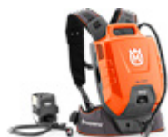
966 77 59-01 Ryggburet Batteri

Litiumjonbatteriet ger effekt som räcker långt, och har en utmärkt prestanda som gör att du kan arbeta