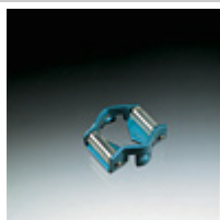
580 68 74-01 Kombimall 1/4" H00

verktyg. Används tillsammans med våra rundfilar och flatfilar för en korrekt filningsvinkel. Tillgänglig för alla Husqvarnas kedjor.