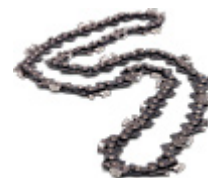
501 84 40-60 Kedja 10" 1/4" 1,3 mm

H38 är gjord för mindre sågar och har Chamfer Chisel skärtänder. En lågvibrations/ låg kastriskkedja. För villaägare, men även för komersiella användare såsom arborister.