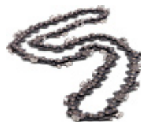
581 80 79-52 Kedja H38 PIXEL 3/8" MINI 1,1 mm

H38 är gjord för mindre sågar och har Chamfer Chisel skärtänder. En lågvibrations/ låg kastriskkedja. För villaägare, men även för komersiella användare såsom arborister. Rekommenderas för