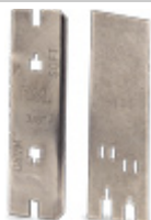
505 69 81-03 Ryrtarmall 3/8" MINI

Med rätt filad underställning får du maximal avverkningskapacitet.