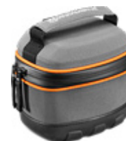
585 37 18-01 Batteriväska

Husqvarnas batteriladdare för litiumjonbatterier ger