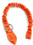
577 43 80-01 Motorsågsstropp

En elastisk stropp att användas med en verktgskrok för att koppla motorsågen till ett bälte. Mäter 0,5 m slak och 1,25 m helt utsträckt.