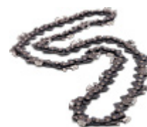
581 80 79-40 Kedja H38 PIXEL 3/8" MINI 1,1 mm

Utformad särskilt för din motorsåg. Extra fickor för motorsågsfilare och en ficka med kardborreband på utsidan.