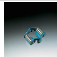
580 68 74-01 Kombimall 1/4" H00

Specialkonstruerade filmallar för rätt filningsvinkel. Finns