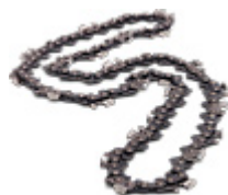
581 80 79-45 Kedja H38 PIXEL 3/8" MINI 1,1 mm

H38 är gjord för mindre sågar och har Chamfer Chisel skärtänder. En lågvibrations/ låg kastriskkedja. För villaägare, men även för komersiella användare såsom arborister. Rekommenderas för