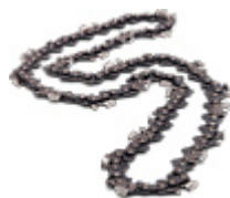
501 84 40-68 Kedja 12" 1/4" 1,3 mm

En extremt lätt kedja för mjuk och ren kapning med skärtänder i Micro Chisel profil.