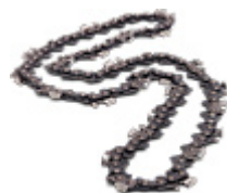
581 80 79-40 Kedja H38 PIXEL 3/8" MINI 1,1 mm

H38 är gjord för mindre sågar och har Chamfer Chisel skärtänder. En lågvibrations/ låg kastriskkedja. För villaägare, men även för komersiella användare såsom arborister. Rekommenderas för användning på elsågar och mindre bensinsågar.