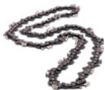
501 84 40-60 Kedja 10" 1/4" 1,3 mm

Rekommenderas för användning på elsågar och mindre bensinsågar.